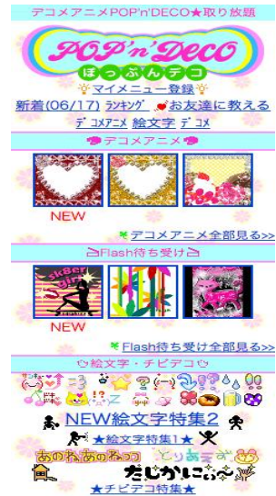
サイトトップ画面